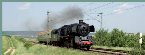
50 3501, gebaut 1940 bei Borsig, Reko 1957, seit 1986 im DLW Meiningen, hier im Jahr 2007 bei Würzburg

Der Meiningener Dampflokomotivverein e.V. wurde im April 1999 ins Leben gerufen. Die Ziele des MDV sind u. a. der Erhalt der Traditions-Dampflokomotive des Dampflokomotivwerks Meiningen, der 50 3501, sowie die Planung und Durchführung von Dampfsonderfahrten.